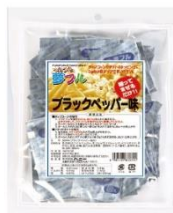
ブラックペッパー